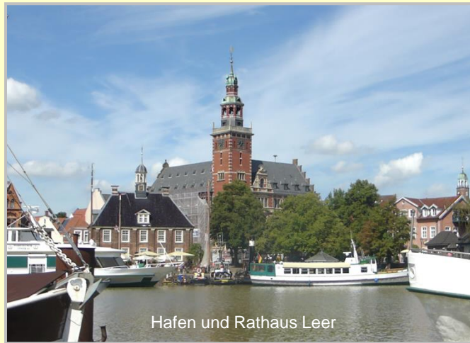
Hafen und Rathaus Leer

Zu diesem Gebiet gehört auch der Elisabethfehnkanal als unersetzliches Baudenkmal der Fehnsiedlungen dieser Region. Einst durchzogen unzählige von Hand gegrabene Kanäle das Gebiet zwischen Ijssel und Weser, um die bis dahin unwegsamen Moore zu erschließen. Nur dieser harten Pionierarbeit ist es zu verdanken, dass diese Landstriche bewohnbar wurden und Ackerflächen geschaffen wurden.